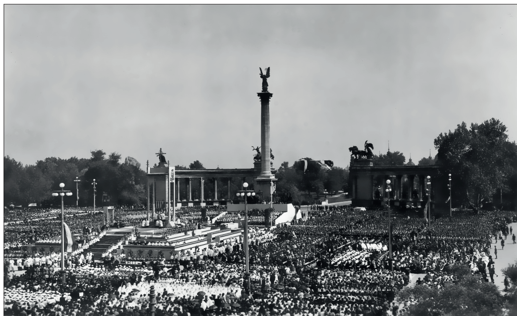
A XXVIII. Katolikus Nagygyűlés oltára a Hősök terén, 1939-ben.