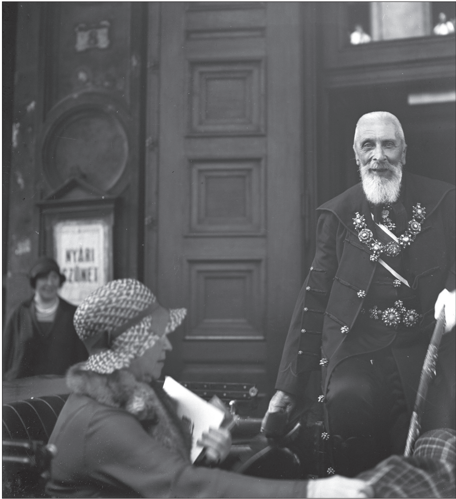
Gróf Apponyi Albert az Operaház Hajós utcai bejáratnál, 1930-ban.