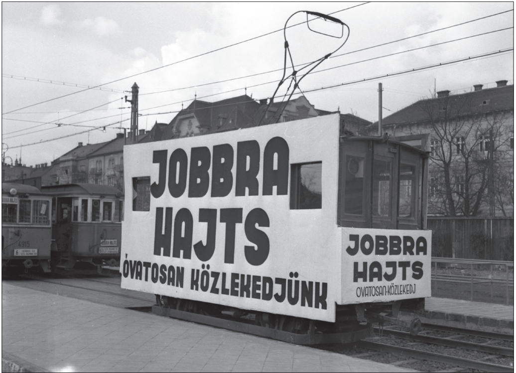
A budapesti Széll Kálmán tér az 1941-es közlekedési átállás idején.