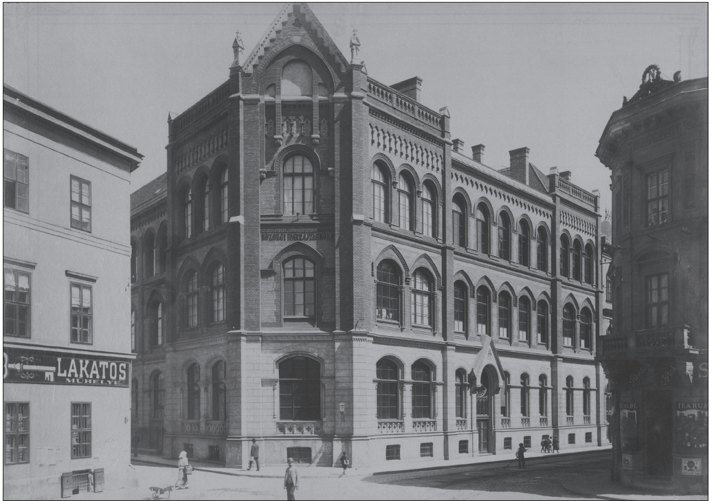
A Lónyay utcai Iparrajziskola Budapesten 1890 után. Levéltári jelzet: HU.BFL.XV.19.d.1.07.094