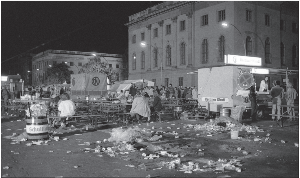
A Humboldt Egyetem az Unter den Linden sugárúton Berlinben, 1990-ben.