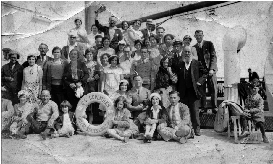
Amerikai kivándorlók az S. S. Leviathan fedélzetén 1923-ban.