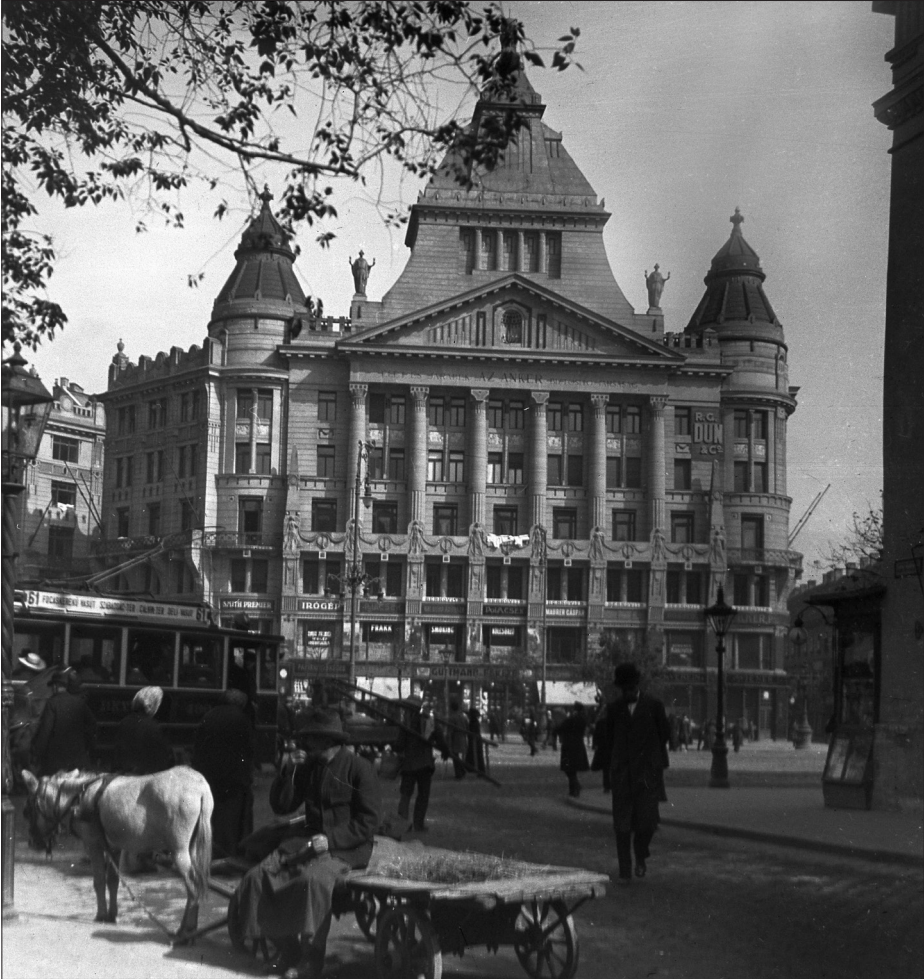
A budapesti Anker-palota 1912-ben. 1910 és 1919 között itt volt a Galilei Kör székhelye.