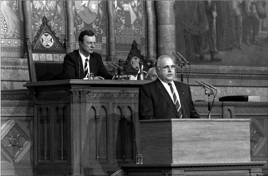
Helmut Kohl német kancellár beszéde a Parlamentben 1990-ben. Mögötte Fodor István, az Országgyűlés megbízott elnöke.