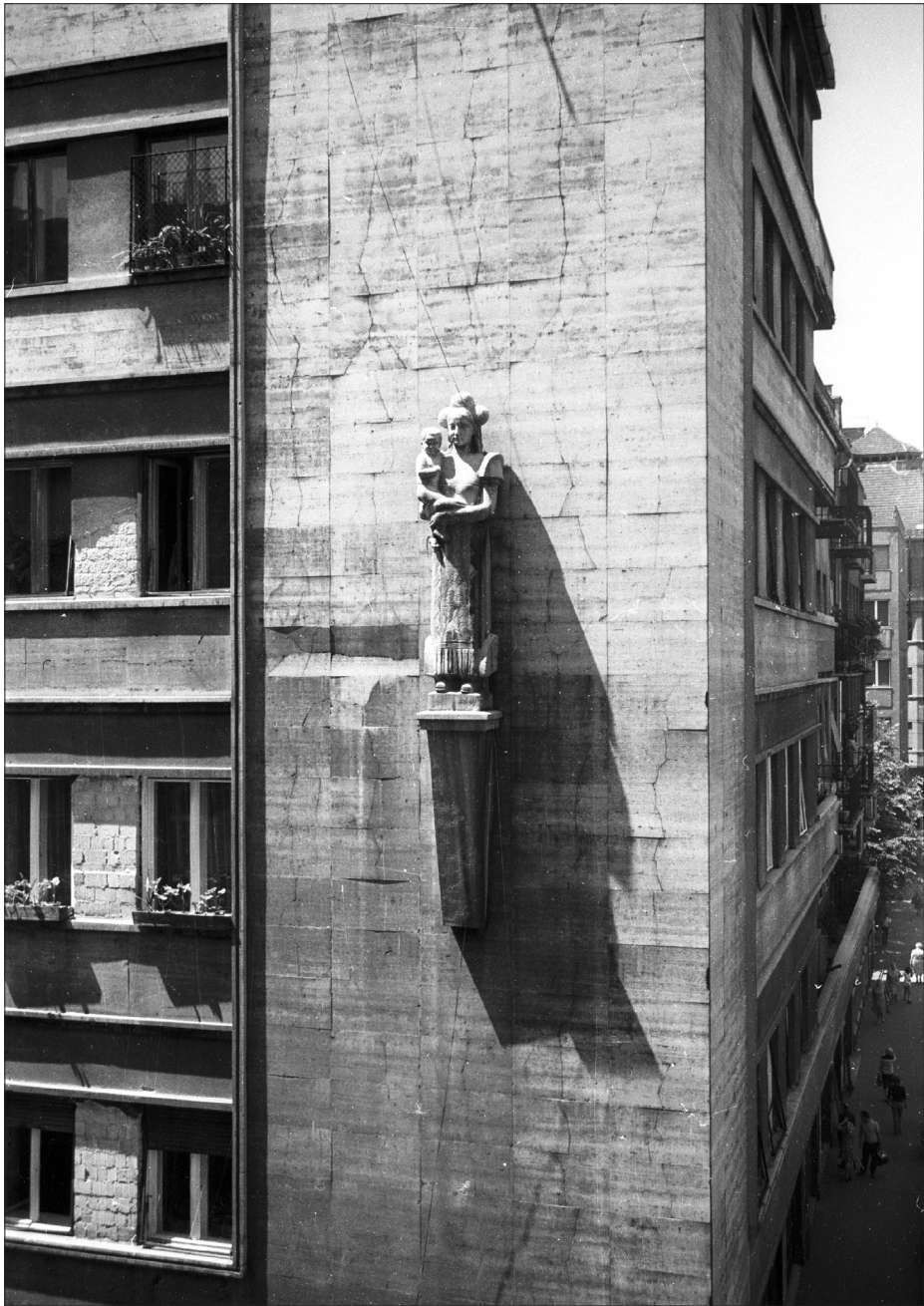
1980: Sóváry János szobra a budapesti Visegrádi utca 38/b alatti bérház (tervezte: Krausz Gábor) homlokzatán.