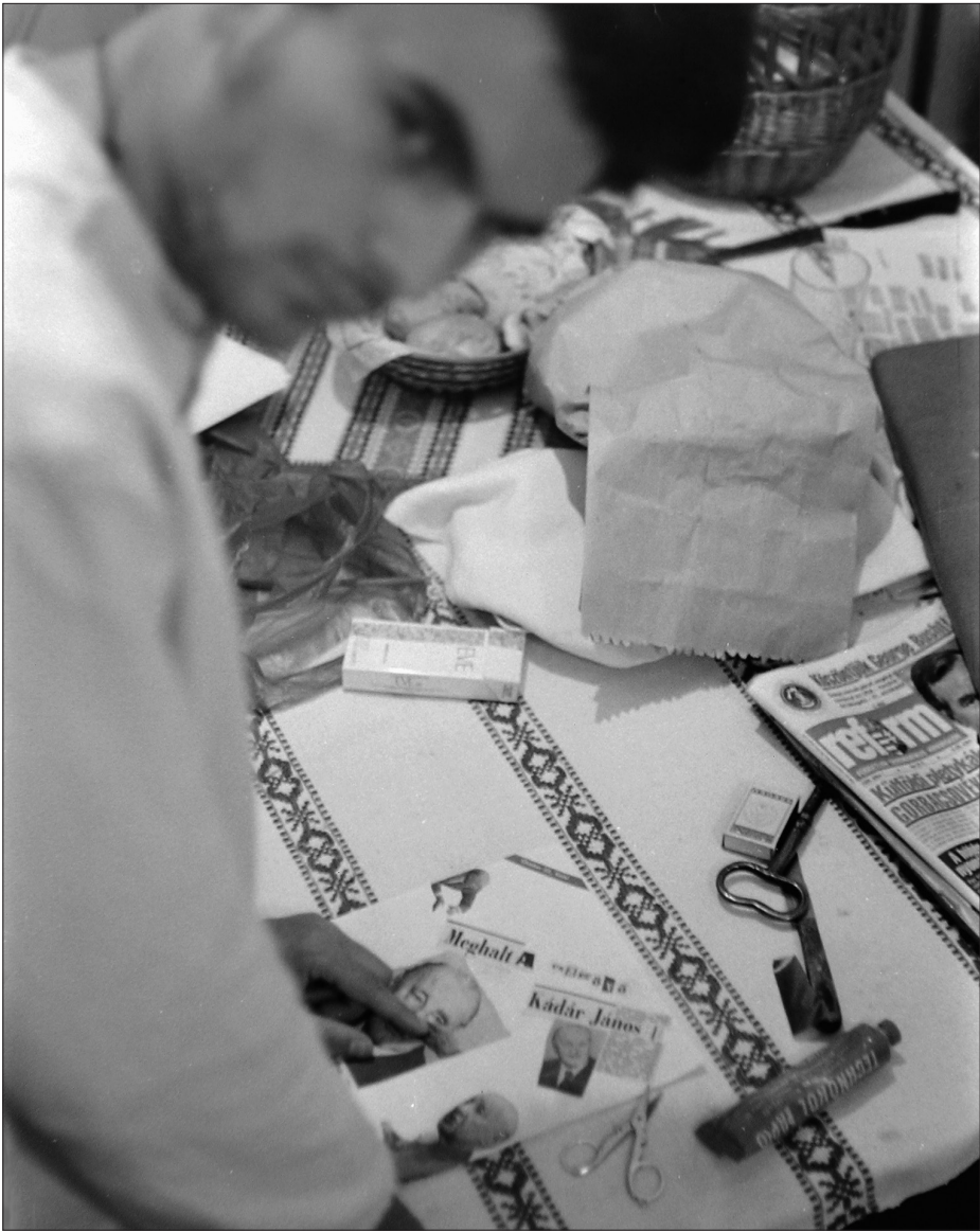
Magyarországi hangulatkép 1989 júniusából.