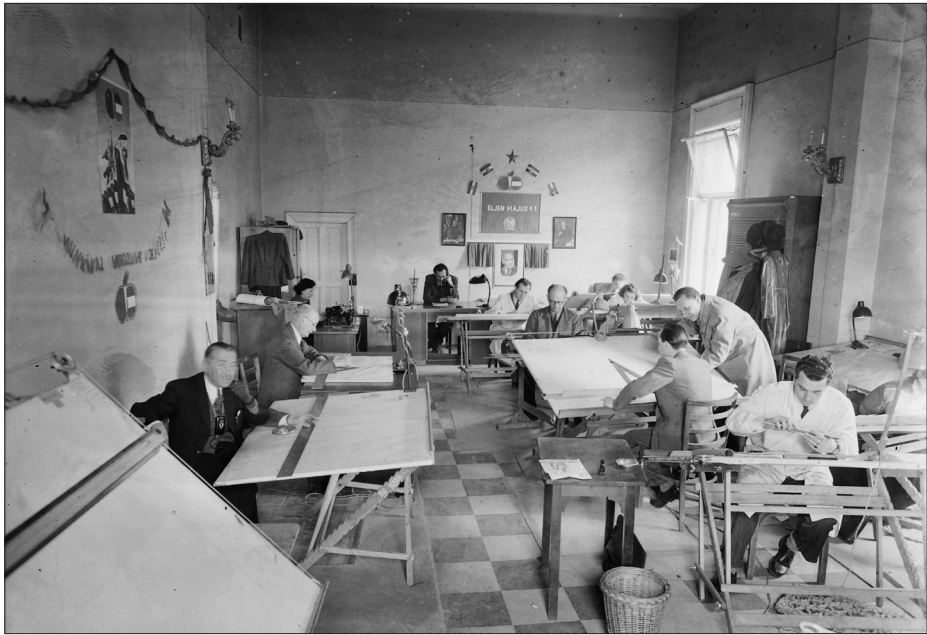
Az Uvaterv mérnökei a vállalat egyik irodájában 1951-ben.