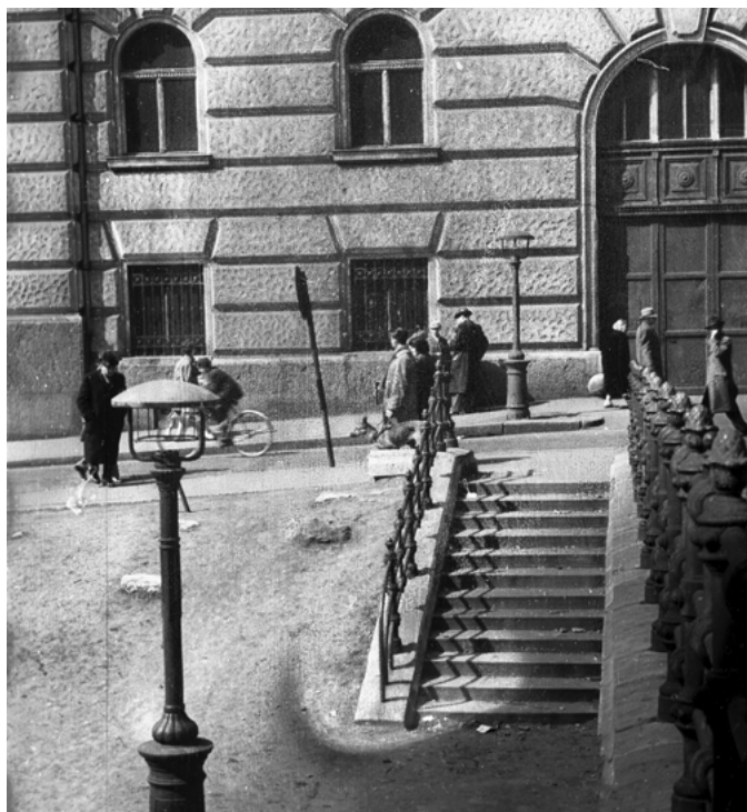
1960: Átjáró a Belvárosi templom mellett, a Szabad sajtó út irányából a Piarista közre (Pesti Barnabás) nézve. Itt indul majd újra a pszichológusképzés 30