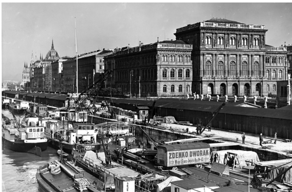
A Magyar Tudományos Akadémia épülete 1928-ban 17

A pszichológia felemelkedésének egyik mérföldkövéként tartjuk ma is számon, hogy 1928-ban megalakult a Magyar Pszichológiai Társaság, s elindult tudományos folyóirata, a Magyar Pszichológiai Szemle . A társaság célként tűzte ki a pszichológia önálló tudományként való elismertetését.