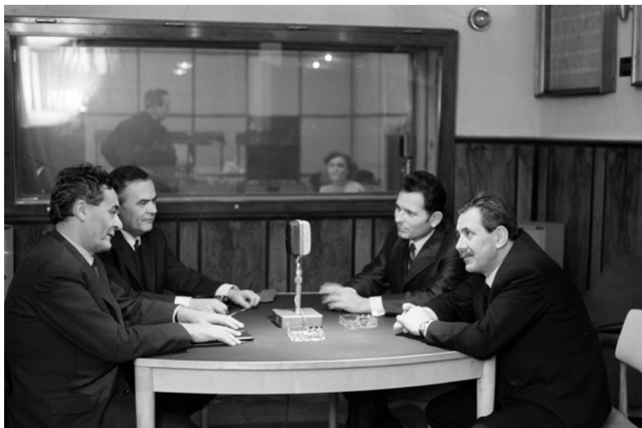
1971: A Magyar Rádió stúdiója, A tudományos közélet fóruma című rádióműsor. Erdei Ferenc politikus mint az MTA főtitkára, Pál Lénárd akadémikus, a Központi Fizikai Kutatóintézet igazgatója, Eke Károly riporter, Aczél György politikus 31

A II. osztály Pszichológiai Bizottsága 1978-ban áttekintette az úgynevezett újrendszerű pszichológusképzés tapasztalatait, 1979 májusában értékelt a Pszichológiai Intézetben folyó általános pszichológiai, szociálpszichológiai, személyiség- és klinikai pszichológiai kutatásokat. Az értékelés már akkor kiemelte a pszichofiziológia kimagasló eredményeit, műszerezettségét, tudományközi jellegét, vezető kutatóinak teljesítményét. Ez ma is az egykori intézet utódaiban a pszichológiai kutatások élettudományi ágát művelő műhelyekben folyó kutatások területe.